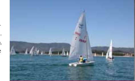
( Lago di Bilancino - Barberino di Mugello )

- il cicloturismo : in bicicletta da corsa e in mountain bike respirando a pieni polmoni un'aria pulita e ossigenata;