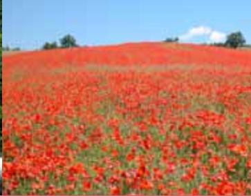
( Campo di papaveri a Firenzuola )

- la pesca sportiva , l' arrampicata , la canoa , il tiro con l'arco , l' orienteeing e tante altre attività per godere appieno del proprio tempo libero, in risposta a un sistema di vita e di lavoro sempre più stressante.