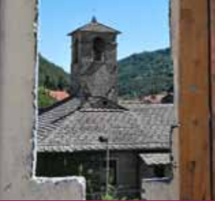
( Palazzo dei Capitani - Palazzuolo sul Senio )