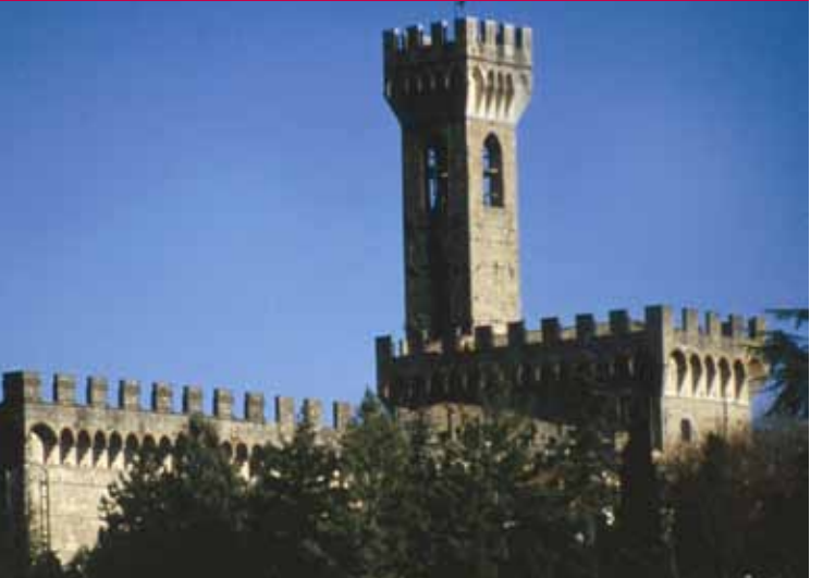
Palazzo dei Vicari - Scarperia