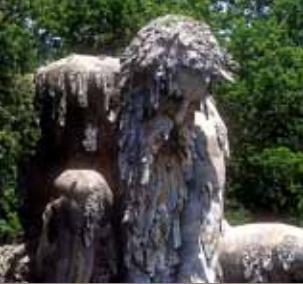
( Gigante dell'Appennino nel Parco Mediceo di Pratolino - Vaglia )