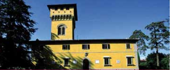
( Villa Pecori Girdali - Borgo San Lorenzo )

• Dirigendosi verso San Piero a Sieve si incontra la Villa Medicea di Cafaggiolo , residenza tra le preferite di Lorenzo il Magnifico, splendido esempio di architettura rinascimentale (tel. 055 84527185) e poco distante in cima ad un colle, circondato da cipressi, si intravede il Castello del Trebbio , altro superbo edificio medico (tel. 055 848088 - 339 3029697).